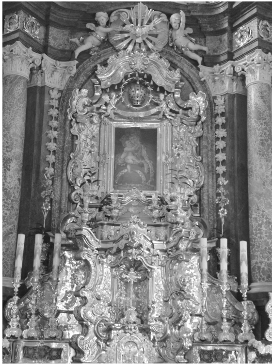
Hochaltar der Amberger Wallfahrtskirche Maria Hilf