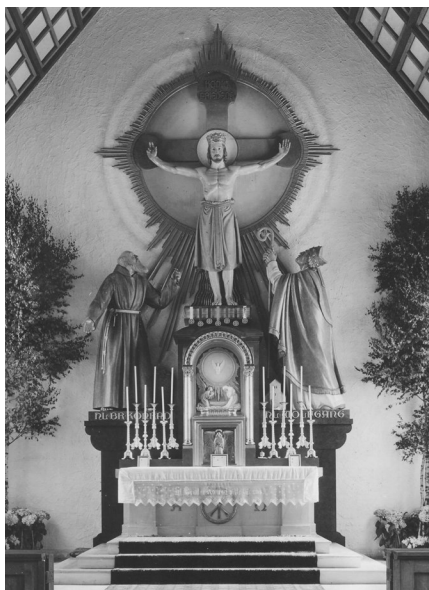
Hochaltar der ersten Bruder-Konrad-Kirche (1939 bis 1963)

Wer den ursprünglichen Altar kannte oder ihn sich auf Fotos anschaut, mag darüber staunen, dass der Künstler damals ein so modern anmutendes Werk aus Metall in einen völlig anders gearteten Altar zentriert hat, das sich aber nun wie selbstverständlich in unsere heutige Kirche einfügt!