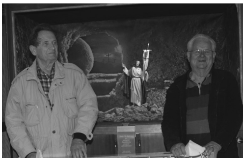
Foto am Karsamstag, 03. April 2021, nach der Umgestaltung auf die Osterdarstellung.